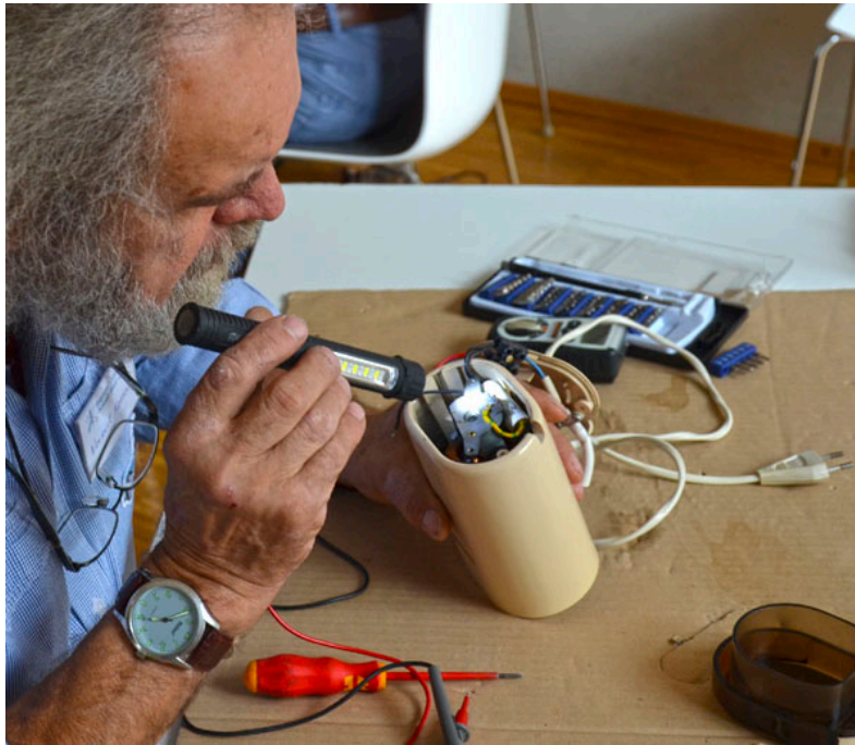
Kaffeemühle mit mindestens 2 t Bohndendurchsatz in 35 Jahren. Geht wieder!

Wie versprochen: diesmal wieder mit ein paar Fotos, genauer gesagt "Stimmungsfotos". Denn schließlich wollen wir nicht die Betriebsgeheimnisse unserer Reparatere herausposaunen :))