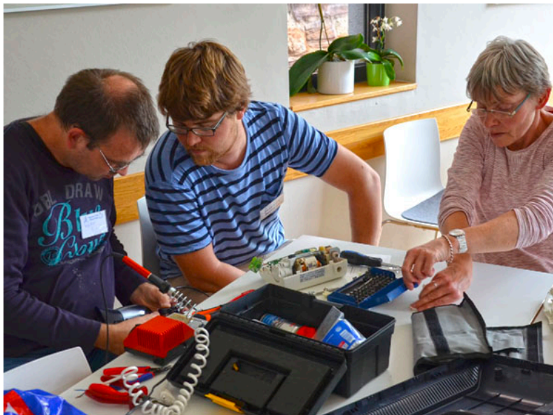
Volle Konzentration beim Multitasking. Hier werden Fön und Radio simultan behandelt. Ergebnis: Der Fön kann jetzt HR4!