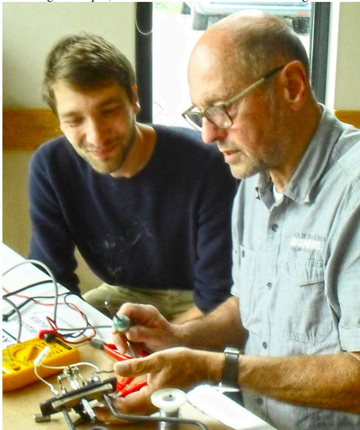
Schön zu sehen, wenn der Vater mit dem

Was gab es diesmal an Herausforderungen? Eine Luftpumpe, drei Schmuck-Uhren (Meine Damen: Wenn man den Aufzug überdreht bis es knackt, dann ist die Feder gebrochen. Und das war's dann, es sei denn es handelt sich um ein Schweizer Chronometer!). Dann waren da noch: Kaffeemaschine, Handmixer, Grill, Rasierapparat, Staubsauger (nicht zu knacken :( ), ein Fernseher, diverse Messer und Textilien. Fazit: Hat Spass gemacht, Stimmung war super, Kuchen fast alle - so kann es weiter gehen!